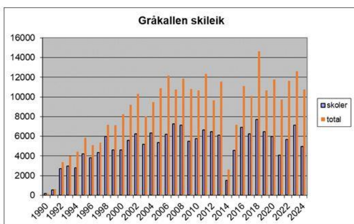
Besøksstatistikk for Gråkallen skileik

Skileiken var betjent i 37 (37) dager for helgebesøk, i nyttårshelgen, vinterferien og påsken. Dessuten har vi hatt noen helger hvor skileiken har vært preparert, men hvor vi ikke har klart å stille med betjening. Publikum er likevel villig til å Vippsse betaling. Samlet registrert besøk på disse dagene var 3 586 (3 078) altså